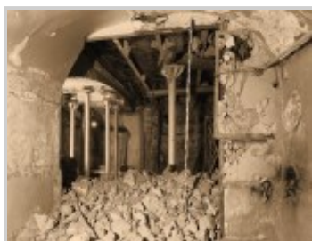
Ремонтно-восстановительные работы в храме-усыпальнице св. прав. Иоанна Кронштадтского