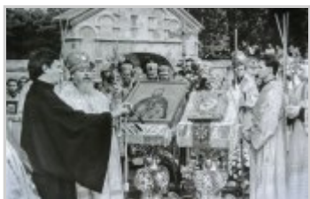
Торжества прославления св. прав. Иоанна Кронштадтского 14 июня 1990 г.