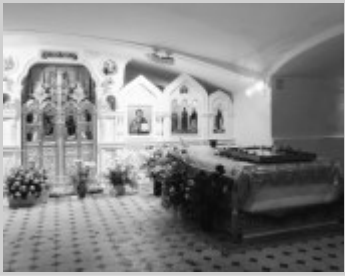
Храм-усыпальница в 1990- е гг.

При перепубликации просим ссылаться на первоисточник: Иоанновский ставропигиальный женский монастырь города Санкт-Петербурга