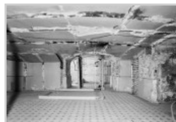
Храм-усыпальница во время реставрации