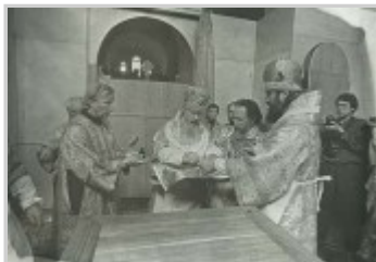
Освящение храма преп. Иоанна Рыльского