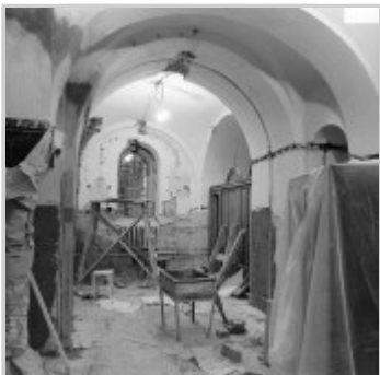
Ремонтно-восстановительные работы в храме-приветствии в монастыре Врлянского.