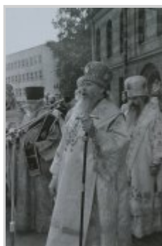
Торжества прославления св. прав. Иоанна Кронштадтского 14 июня 1990 г.