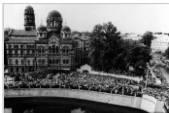
Торжества прославления св. прав. Иоанна Кронштадтского 14 июня 1990 г.