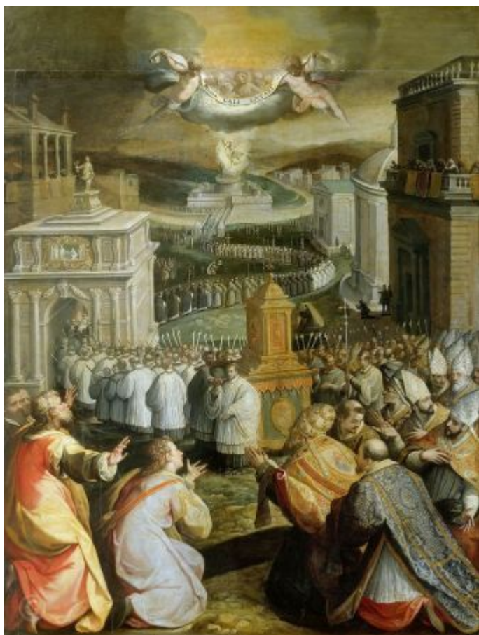
Процессия святого Григория Великого

Примерам помощи Божией при различных болезнях, моровых поветриях и прочих напастях несть числа. И всегда возникали они тогда, когда люди отступали от Бога, и прекращались, когда с покаянием призывали помощь Божию.